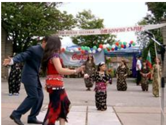
Велико Търново Ви очаква!