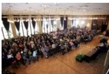
Дебатът за ромите в НДК

В продължение на два дни, на 14 и 15 април 2007, в София се проведе един уникален социален експеримент на тема „Политики към ромите в България“. Организаторите от Центъра за либерални стратегии, Отворено общество, Алфа ризърч и БНТ поканиха в НДК случайно подбрана представителна извадка от 250 души от цялата страна, които да се съберат на едно място и да дебатират. Така на хората се даде възможността да сплъснат своите мнения и предразсъдъци, да чуят мненията на експерти, общественици, политици. Идеята на дебата бе да се регистрира промяната в мнението на участниците преди и след като се запознаят с проблема.