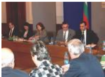
Заседание на НССЕДВ

Рамковата програма за интеграция на ромите в българското общество е приета на 22 април 1999 г. с Решение на Министерския съвет. Едни от специфичните цели, заложи в Плана за действие за изпълнение на Рамковата програма са формиране на убеденост, че публичните инвестиции за интеграция на ромите са в интерес на всички; включване на мерки за решаване проблемите на ромите в стратегическите и плановете документи по структурната политика; разработване на дългосрочен план за действия за пълнопрвно интегриране на ромите в обществото и др. Основни изпълнители на Плана за действие за изпълнение на РПРИРБО за 2006 г. са НССЕДВ, Дирекция ЕДВ към МС, МТСП, Агенция по заетостта, МОН, МЗ, МРРБ и МФ