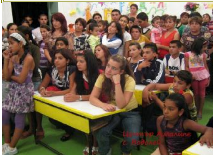
Център Амалипе с Водолей