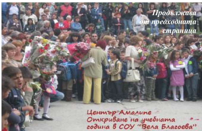
Продължава от предходната страница