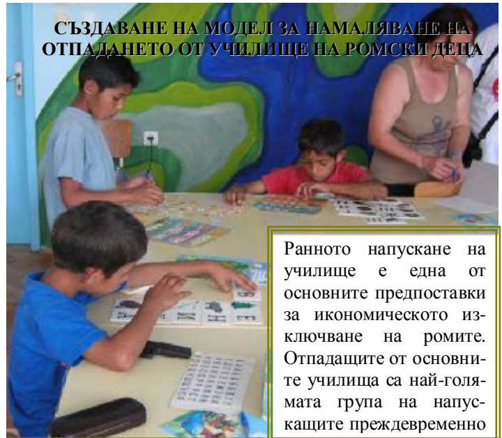
СЪЗДАВАНЕ НА МОДЕЛ ЗА НАМАЛЯВАНЕ НА ОТПАДАНЕТО ОТ УЧИЛИЩЕ НА РОМСКИ ДЕЦА

По време на семинара се проведе и второто заседание на УК на проект ПЛАТФОРМА. На него бе отчетен напредъка по проекта и начините за подобряване на изпълнението му. Дискутиран бе и въпроса за привличането на повече ромски експерти в процеса на консултиране на проекти. Първите резултати сочат, че през първите 6 месеца от началото на инициативата са получени над 120 заявки. Една трета от проектните идеи са получили консултации или са в процес на консултиране.