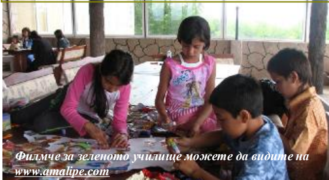
Филмче за зеленото училище можете да видите на www.amalipe.com

Център „Амалипе” проведе тридневно зелено училище от 2 до 4 юни, което бе част от Проекта „Въвеждане на интеркултурно образование и равен достъп до качествено образование в община Велико Търново”, съфинансиран от Европейския социален фонд по ОПРЧР. В инициатива участваха деца и родители от ОУ „Христо Смирненски”, с.Водолей, ОУ „Св. Иван Рилски”, с. Балван, ОУ „Васил Левски, с. Леденик, както и ОУ „П.Р.Славейков, гр. В. Търново. Децата отпочиваха и се забавляваха в хотел „Лесопарк” в близост до манастир „Св.Петър и Павел”, гр. Лясковец. Целта на зеленото училище бе както опознаване на децата от различните училища, така и изграждане на отношения между техните