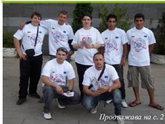
Продължава на с. 2

в София, В. Търново, с. Камен, Монтана, Разград, Стара Загора, Бургас и др. Кампанията бе оповестена на специална пресконференция в София на 28 юни, на която присъстваха нейните основни инициатори