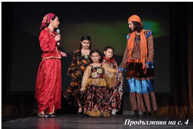
Продължава на с. 4

Спектакълът Roma Fashion е театрално модно ревю, което представя циганска мода от целия свят. Започва с традицията - пред зрителите оживяват характерни занаяти и облекла на ромските жени през вековете. Втората част на спектакъла проследява дългия път на циганите от Индия чак до Америка - невероятните черни поли на циганките от Финландия, носени и до днес, омагьосват пространството заедно с пъстрите поли от Румъния, Унгария и Аржентина. Страстният колорит на испанското фламенко и магията на руските романи допълват световната палитра. Трета,